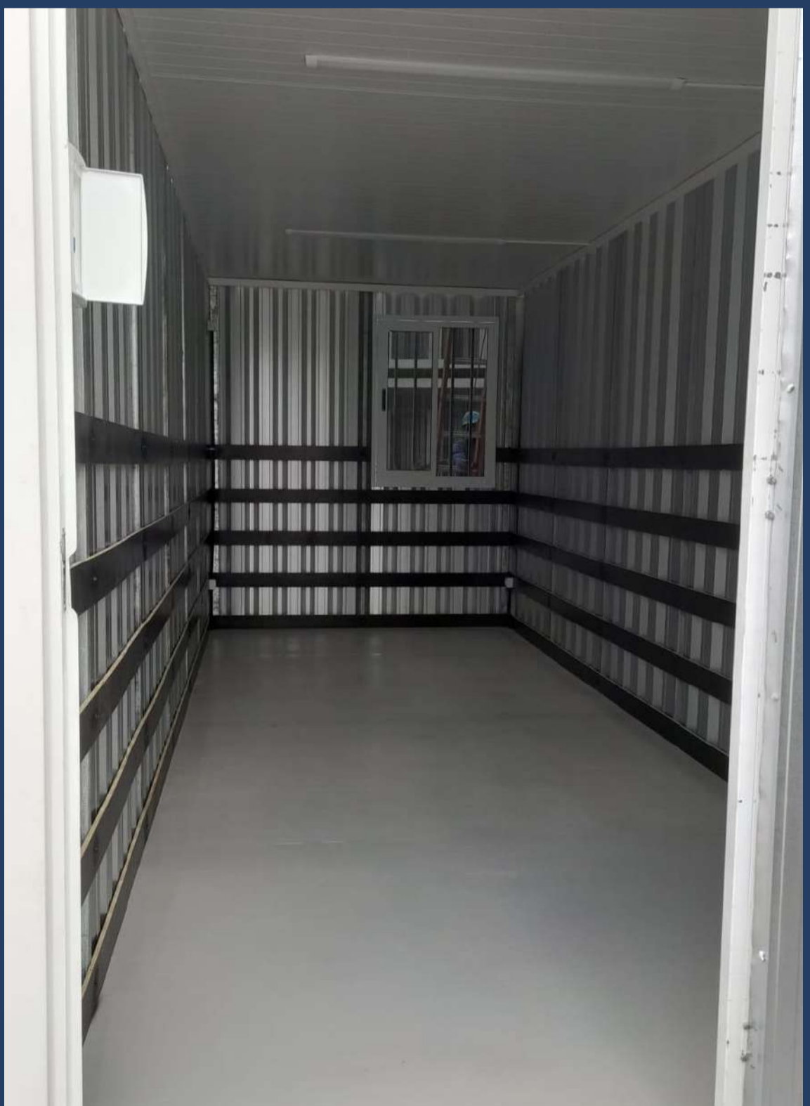
BR 101, nº 01, Taborda-São José de Mipibu/RN momo.net.br